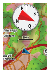
Procesador de trayecto